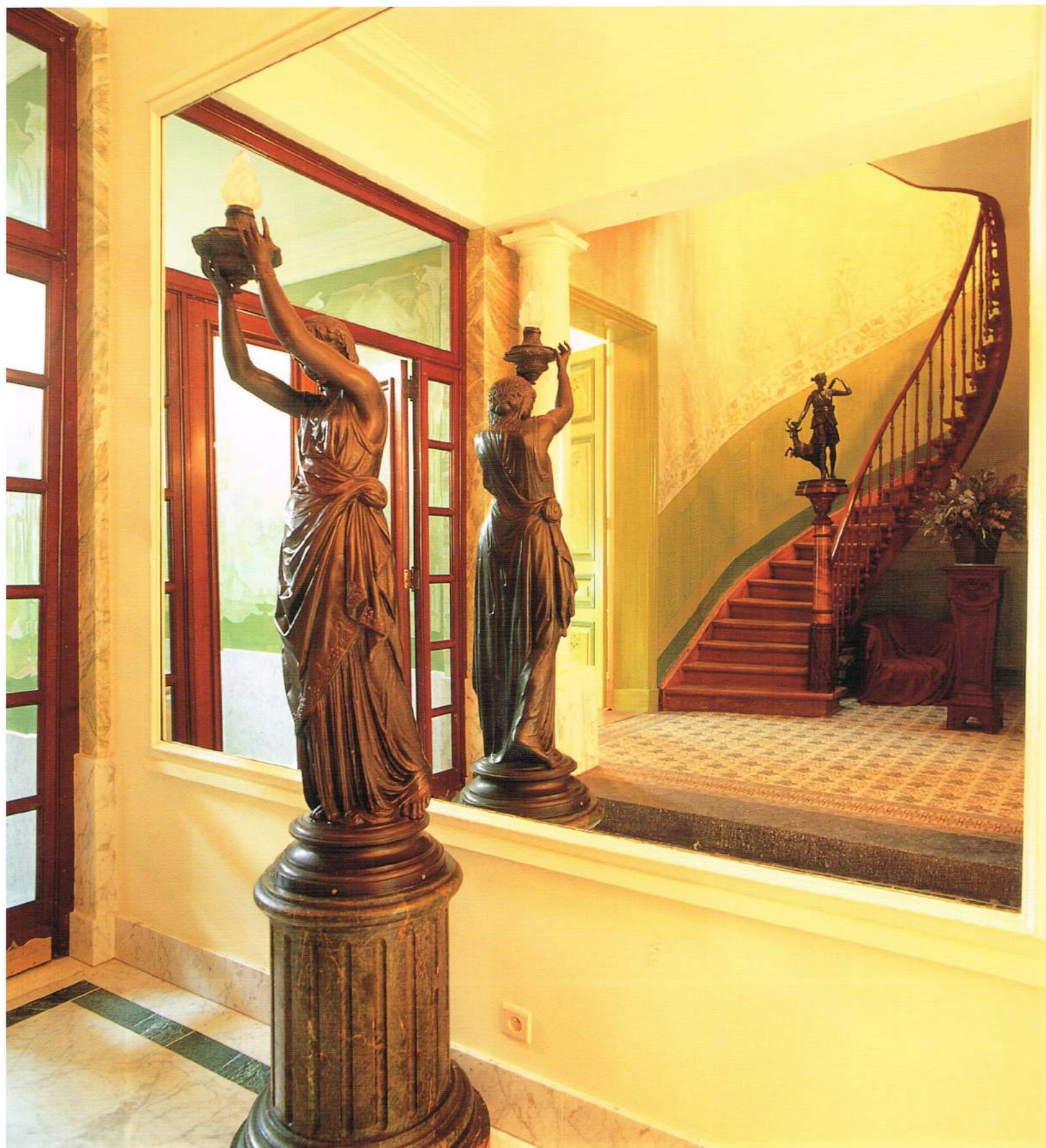
☒ Twee zuilen staan als wachters naast de toegang tot de centraal op het gelijkvloers ingetekende traphal. De eerste opdracht bestond erin om deze constructie bij te werken tot een zo perfect mogelijke ronde vorm. Daarna volgde het toepassen van een marmer-schildertechniek. Naast één van de zuilen zit ook nog een vlak met een zelfde bewerking, dat volledig intact is gebleven en dateert van rond 1830.