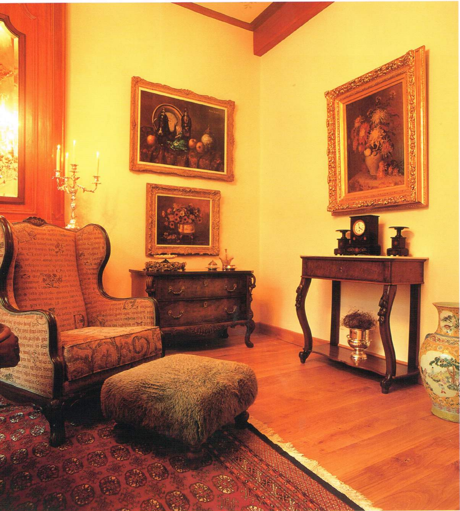
☒ Bij het aanvatten van dit grootschalige renovatie- en restauratieproject stond de woning overvol met oude meubelen. Katleen Godyns catalogeerde ze allemaal en maakte een selectie voor restauratie. Aansluitend werd een meubelplan opgesteld om elk stuk een nieuwe plek te bezorgen.